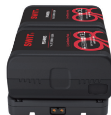
小巧紧凑 左右宽度均衡