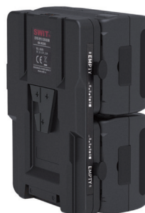
每个电池独立配备 电源指示灯/热切换指示灯