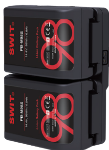
安装2个PB-M98S口袋V口电池 98Wh+98Wh=196Wh